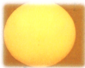
黒点が見える太陽

見え隠れする太陽を撮影していると、なんと霧がよいフィルターになって太陽の黒点が見えているんです。本当に珍しいことに出会えました。この黒点は地球