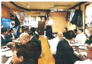
より交流が深まった望年会

先月はAIG熊本支店のみなさんと恒例の忘年会を行いました。昨年のことだけに、何だか遠い昔のことのようです。本年もよろしくお願ひ申し上げます。