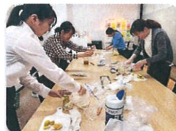
酵素シロップ作り風景

また、先日は熊本県の「持続可能な健康経営」に参加しました。人的資本から企業の成長を促し社会の発展に繋げていくことの重要性や、コミュニケーションこそが健康づくりの成果に繋がる鍵になるという真の健康経営の基礎を改めて勉強できました。