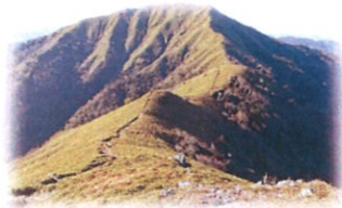
山剣山から次郎岨へ続く稜線

私の好きなビューポイントは次郎岨へ続く稜線です。ここは歩くのもとても気持ち良く右を見ても左を見ても遮るものはなく遠くまで続く山々を眺めることができ、西日本で一番の稜線だと思っています。徳島へ行かれた際はぜひリフトを使って絶景を楽しんでみてください。