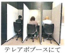
テレアポブースにて

「テレアポ営業II大変」というイメージをお持ちの方も多いたのではないのでしょうか？ ▼上司がマウントを取って「いいからやれ」ということに対し、部下がものを言えない空気では奮起を促すのではなく、やる気がなくなっている状態です。人材の定着が深刻な中、こんなことで転職されたらシャレにもなりません。