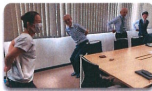
指導士による講習会風景

約1時間の講習会でしたが、レクリエーションのように楽しく、笑い声の絶えないひと時となりました。