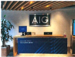
AIG 本社 11 階の受付

先月、AIG損保からセミナーのゲスト参加の依頼があり、コロナ禍以来、久々に虎ノ門の本社に行ってきました。▼やっぱり対面はいいですね。たくさんさんの刺激をいただけてきました。